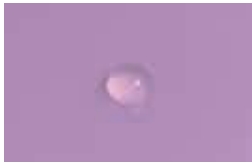
Goutte après 2 secondes