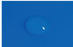
Goutte après 2 secondes